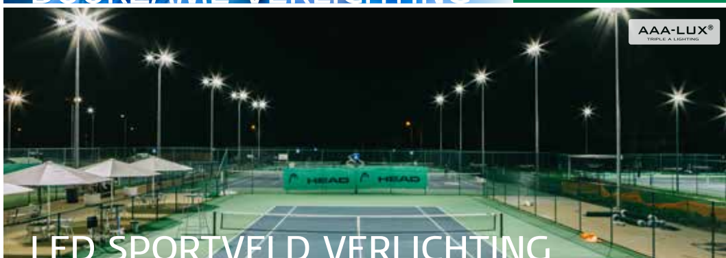
LED SPORTVELD VERLICHTING

Op zoek naar zonnepanelen voor uw woning of bedrijf? Wij kunnen exact voor u uitrekenen wat u aan PV-systemen (photo-voltaic systems) nodig heeft. Daarbij hoort vanzelfsprekend een berekening van energie-opbrengst, investeringskosten en terugverdientijd. Dankzij onze kennis en jarenlange ervaring bent u verzekerd van een betrouwbare installatie. Laat die zonnestralen maar komen! Daarnaast leveren wij energiezuinige LED lampen in alle soorten en maten.