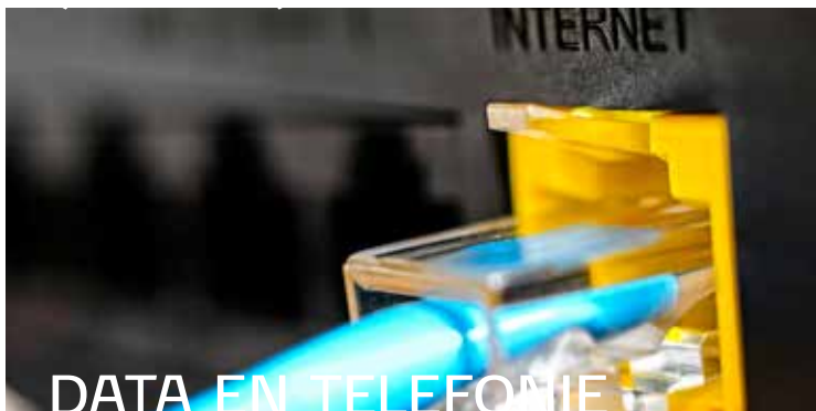
DATA EN TELEFONIE